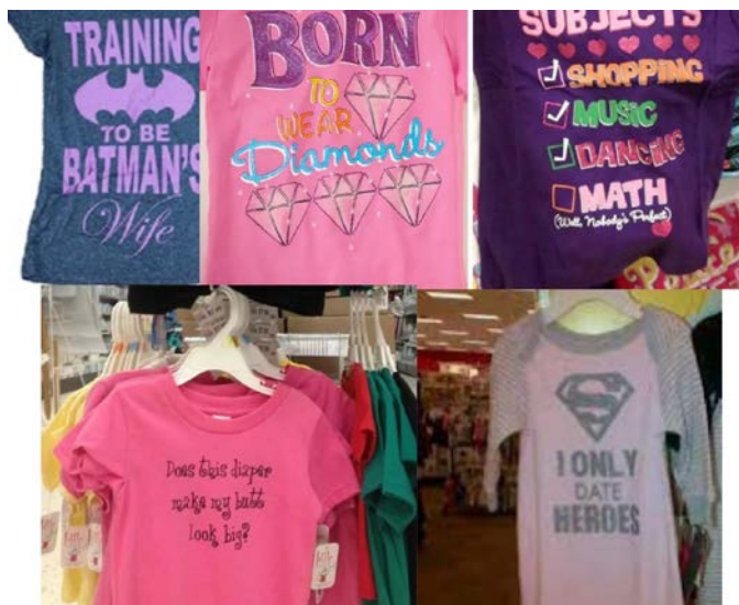
Одежда, представленная в отделах одежды для девочек.

Далее в статье будет рассмотрены наиболее наглядные ситуации, которые выступят подтверждением тезиса о разрушительности мизогинного мышления.