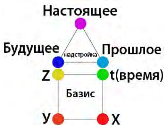
Рисунок 1. Совокупность элементов исторического материализма

Рассмотренный перечень программ позволяет их систематизировать и зафиксировать посредством понятий исторического материализма в виде конструкции «базиса» ( греч. Basis – основание ). Как известно «базис» согласно формулировке Карла Маркса (нем. Karl Heinrich Marx; 1818 – 1883 ), основателя «марксизма», представляет из себя совокупность исторически определённых производственных отношений (рисунок 1).